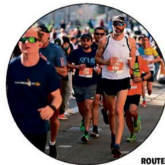
ROUTE. Les Foulées d'Orléans.